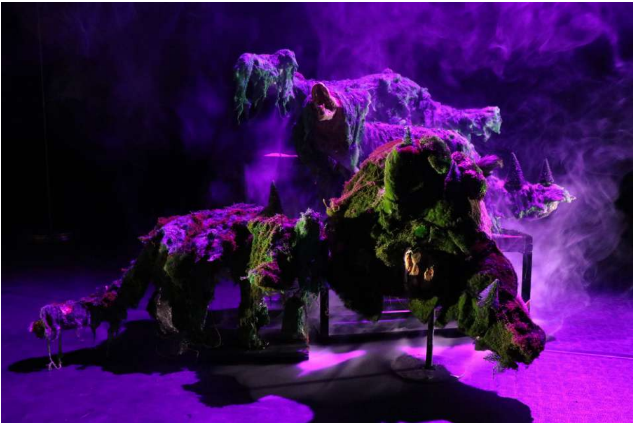
Résidence Théâtre à la Coque

A la Chartreuse de Villeneuve-lez-Avignon, j'ai cherché le croisement des styles narratifs, la construction dramaturgique de ce récit à digressions. J'ai travaillé les ruptures, la rythmicité de l'ensemble, l'adresse directe... Au MeTT, mon écriture s'est nourrie d'une recherche plastique où les territoires fragiles menacés par l'homme prennent corps à travers les têtes empaillées que collectionne Jeff le chasseur : elles deviennent des espaces explorés, colonisés par des marionnettes miniatures, à la fois refuge et incarnation de la peur ou de la monstruosité.