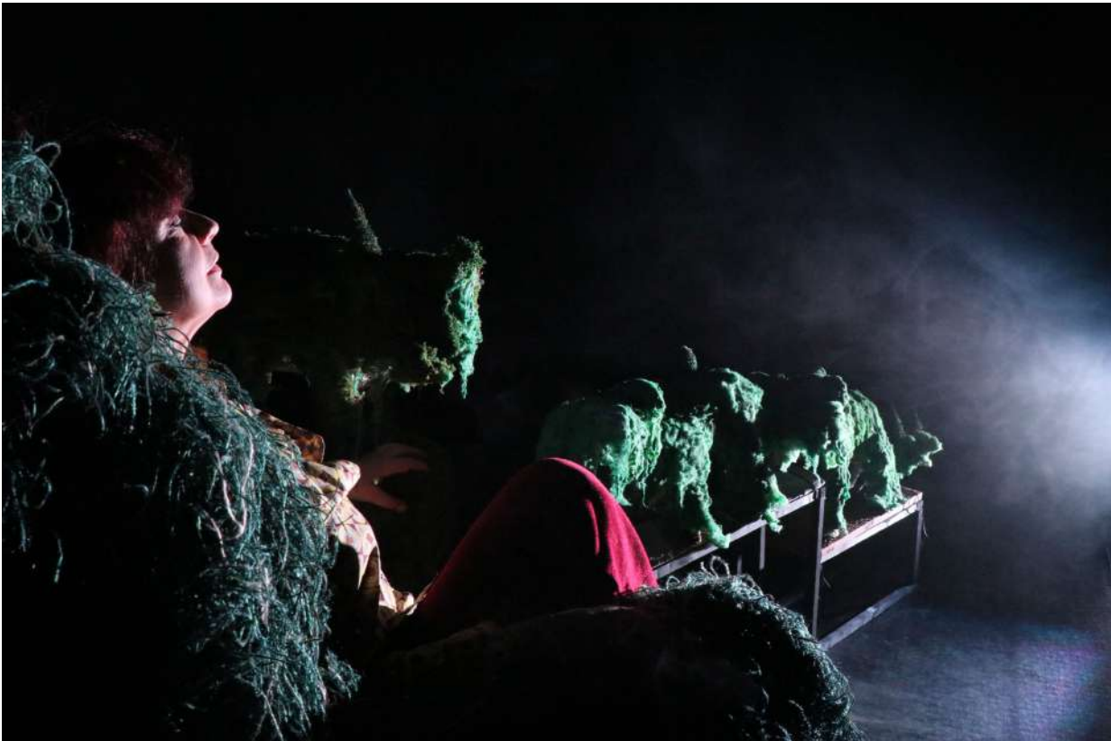
Résidence Théâtre à la Coque