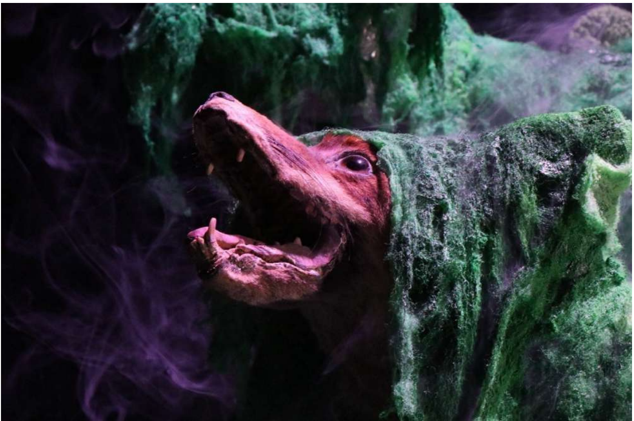
Résidence Théâtre à la Coque

Une démesure qui nous emporte au lointain de nos rêves, de nos idéaux, et nous éloigne de notre nature instinctive et sauvage.