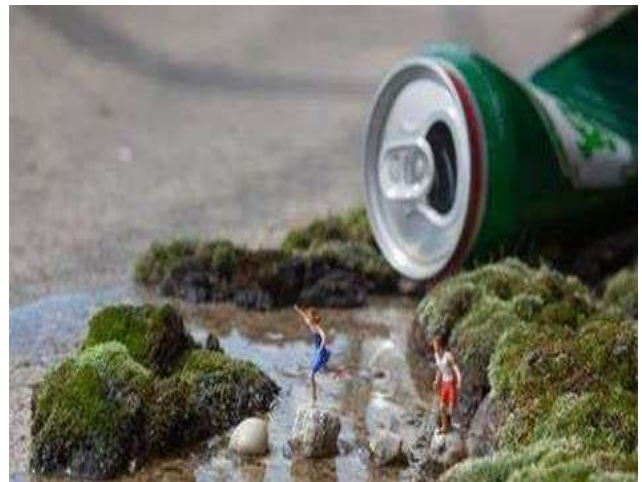
© Slinkachu Bones « Little people »

Il peut être le buisson comme le rocher, le chasseur comme l'animal mort, la femme (à barbe) comme le satyre de la forêt...Présence silencieuse, burlesque ou inquiétante, s'il venait à avoir une voix, sa parole sera précieuse.