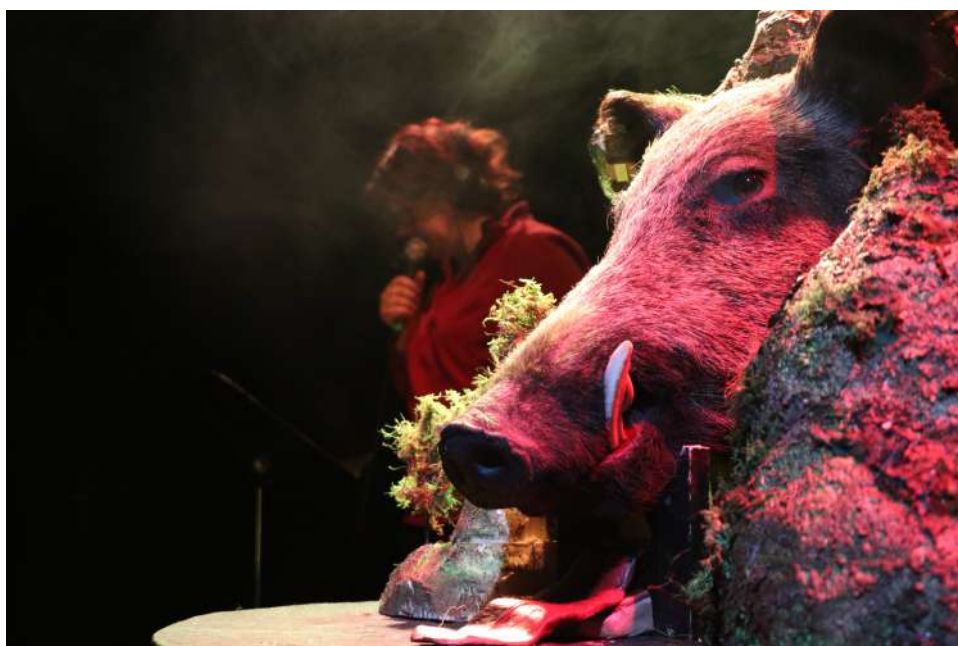
Résidence Le MeTT